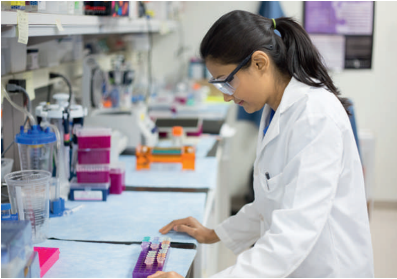
Wissenschaftliche Evidenz braucht zuverlässige Studienergebnisse. Doch die Qualität biomedizinischer Forschung gerät zunehmend in die Kritik.

stehenden Informationen, um die Qualität von Forschungsleistungen zu bewerten. Ist eine Publikation mangelhaft, lässt sich keine zuverlässige Bewertung der Studienergebnisse vornehmen [16].